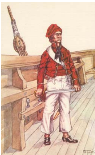
Marinero de la Confederación Argentina 11,19 1840

La ponderosa artillería del Expéditive disparó durante 3 horas a la Batería N° 1 matando prácticamente a todos. A las 4 PM el asistente de Alzogaray disparó su última andanada de un cañón de 24 libras. El teniente Felipe Palacio y el teniente de Navío Eduardo Brown tenían baterías rasantes y por ende no estuvieron involucrados en esta acción. 17 Juan Bautista Thorne con no más de ocho cañones de 10 libras tuvo que combatir contra doce cañones de 64 libras, dos de 80 libras y ocho de 33 libras. A las 5 PM se encontraba prácticamente sin municiones. Thorne recibió dos veces la orden de retirarse pero contestó que aún le quedaban algunos disparos por realizar. Mientras estaba sentado sobre el merlón de la batería arengando a sus hombres un disparo cercano le fracturó un brazo y además golpeó su cabeza contra un tala ( Celtis tala ). Según algunos historiadores fue sordo desde entonces. 20