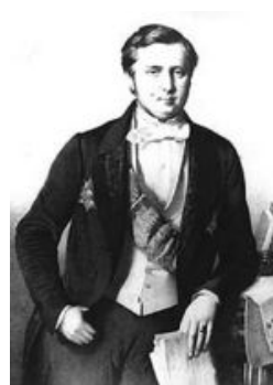
Alexandre Florian Joseph. Duque de Colonna-Waleski (1810-1868)

http://en.wikipedia.org/wiki/William_Gore_Ouseley