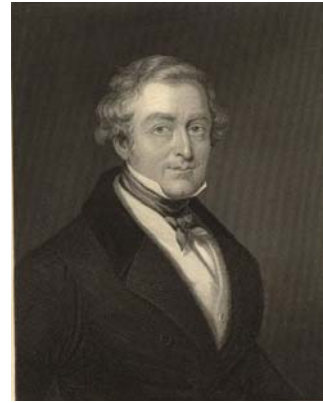
Sir Robert Peel Primer Ministro del Reino Unido durante 1841-1846.

http://en.wikipedia.org/wiki/George_Hamilton-Gordon,_4th_Earl_of_Aberdeen http://en.wikipedia.org/wiki/List_of_