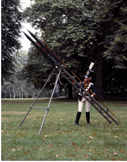
http://www.sciencemuseum.org.uk/images/I016/10278260.aspx Cohetes Congreve

La rampa consistía en una escalera, dos canaletas para los cohetes, dos patas de apoyo para la escalera, una barra para soportar las patas y un cubo. El armazón podía ser atado a un mástil. La trayectoria de los cohetes se podía modificar variando la inclinación de la escalera. Fueron eficaces a pesar de ser algo inexactos y tendientes a explotar prematuramente. El HMS Alecto trajo el 9 de marzo de 1846 un suministro de cohetes Congreve. 25