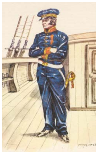
Oficial de Marina de la Confederación 11,19 1843

Sin embargo, Thorne siempre sostuvo que su sordera se debió al combate de Angostura del Quebracho. Podemos presumir que sufría de una moderada hipoacusia en el Combate de Vuelta de Obligado que se tornó absoluta en el Quebracho. Ratto considera que, dado que rehusó obedecer las ordenes, Thorne era moralmente sordo. De todas formas a partir de aquí fue apodado “ el sordo de Obligado ”.