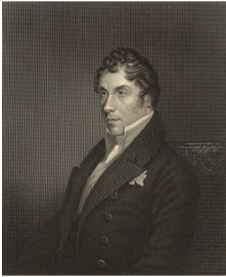
George Hamilton-Gordon, 4th Conde de Aberdeen (1784-1860)

Fue entrevistado por Florencio Varela en un momento de convulsión política para nuestro país. Varela solicitó en nombre de los unitarios la intervención de Gran Bretaña.