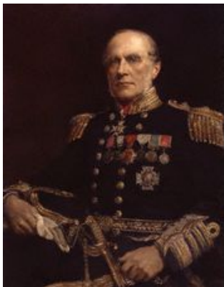
Comandante Edward Augustus Inglefield (1820-1894) Retrato de John Collier, 1897