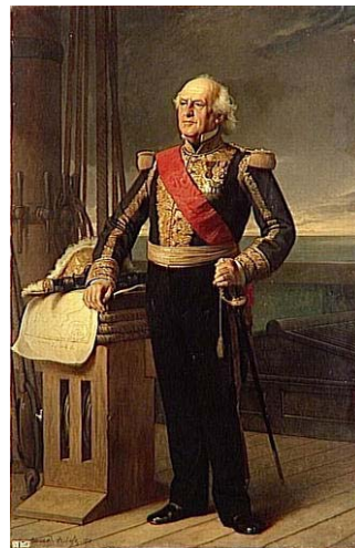
Almirante François Thomas Tréhouart (1798-1873) Museo Nacional de Versailles

http://commons.wikimedia.org/wiki/Image:Fran%C3%A7ois_Thomas_Trehouart.jpg http://es.wikipedia.org/wiki/Edward_Augustus_Inglefield