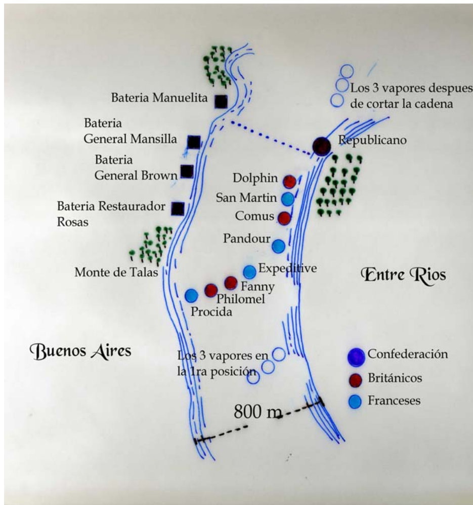
Mapa del Combate de la Vuelta de Obligado Adaptado del libro de Teodoro Caillet-Bois