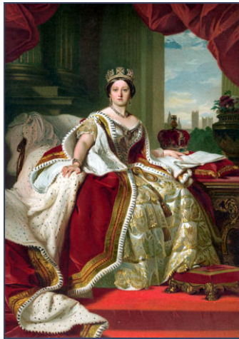
Reina Victoria Reina del Reino Unido de la Gran Bretaña e Irlanda y Primera Emperatriz de la India-

El Combate de la Vuelta de Obligado se llevó a cabo cuando la Confederación Argentina estaba liderada por el brigadier Don Juan Manuel de Rosas. En Gran Bretaña se encontraba la reina Victoria y en Francia el rey Luis Felipe. Este combate tuvo lugar un 20 de noviembre de 1845 en aguas del río Paraná, sobre su costa oriental, al norte de la provincia de Buenos Aires en una curva estrecha denominada Vuelta de Obligado que hoy se conoce como la localidad de Obligado. 1, 9,14,24