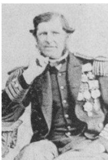
Almirante John Edmund Commerell VC (1829-1901)