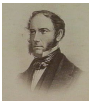
Sir Charles Hotham (1806-1855)

http://www.memorials.inportsmouth.co.uk/vc/commerell.htm