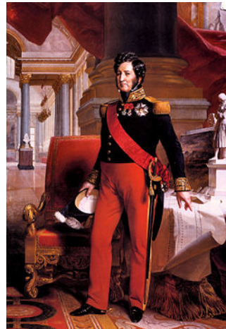
Louis Philippe rey de los franceses El último rey que gobernó Francia

http://www.google.com.ar/search?hl=es&q=Queen+Victoria+picture&btnG=Buscar&meta=